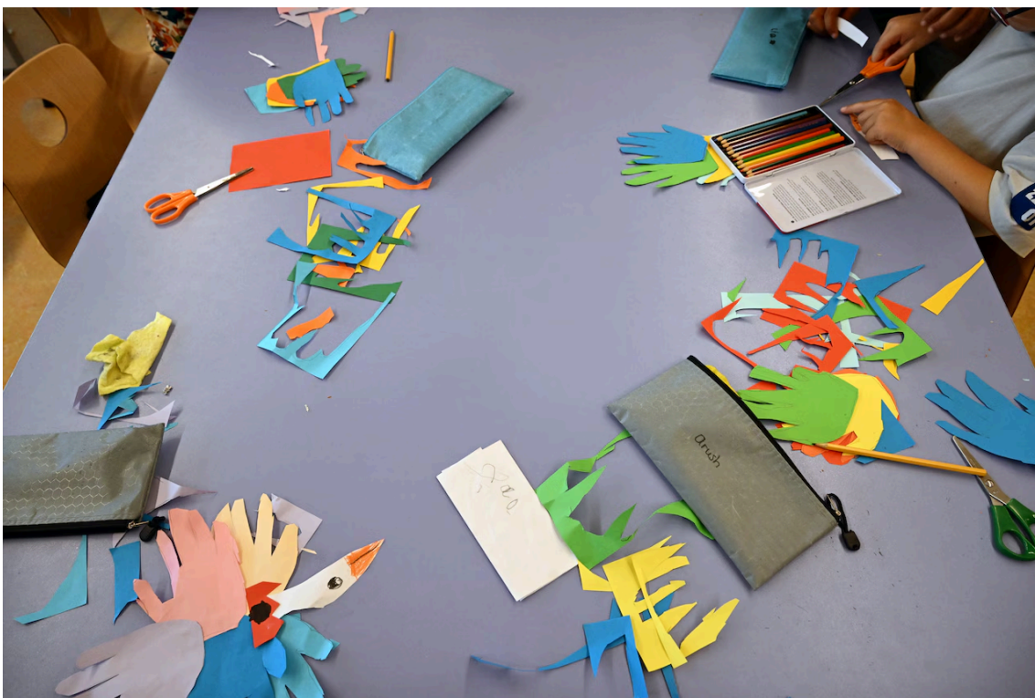
'Cultuurdag' op De Droomspiegel biedt ook ruimte voor les in handvaardigheid. Beeld Marcel van den Bergh / de Volkskrant

Een neveneffect is dat ouders, en dan met name moeders, minder gaan werken. In Amerika zagen onderzoekers de arbeidsparticipatie van vrouwen na invoering van de vierdaagse schoolweek teruglopen, omdat zij zich genoodzaakt voelen om hun kinderen thuis op te vangen.